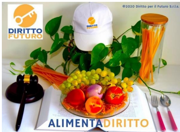
La "Natura viva" a tavola: il Diritto Alimentare con ALIMENTA DIRITTO